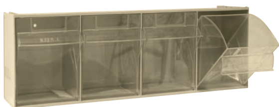
MADIA 4 (60x14x21) 4 contenitori da 14x12,5x19