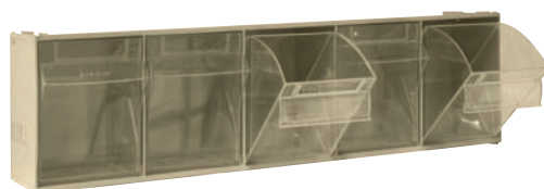
MADIA 3 (60x11,5x16,5) 5 contenitori da 11x10x15