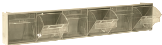
MADIA 2 (60x7,5x11) 6 contenitori da 9x6,5x10