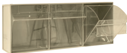
MADIA 5 (60x16x24) 3 contenitori da 18x15x22